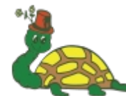
Escuela Infantil Tartaruga